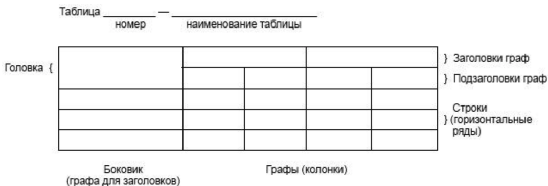
Рисунок 2 – Пример оформления таблицы

Таблицы, за исключением таблиц приложений, следует нумеровать арабскими цифрами сквозной нумерацией. Таблицы каждого приложения обозначаются отдельной нумерацией арабскими цифрами с добавлением перед цифрой обозначения приложения. Если в работе одна таблица, она должна быть обозначена «Таблица 1» или «Таблица А.1» (если она приведена в приложении А). Допускается нумеровать таблицы в пределах раздела при большом объеме данных. В этом случае номер таблицы состоит из номера раздела и порядкового номера таблицы, разделённых точкой: Таблица 2.3.